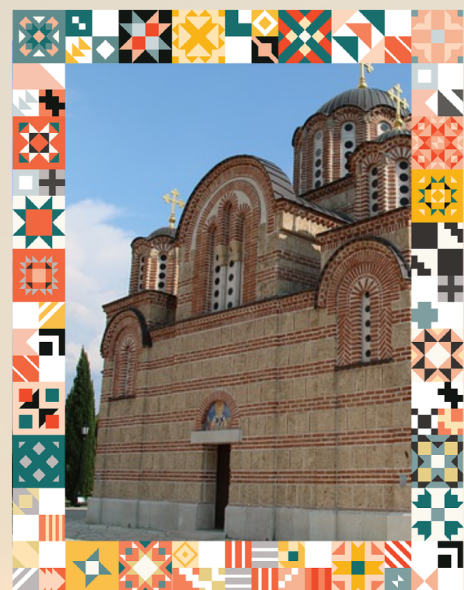
VIAGGIO: DIALOGO INTER-RELIGIOSO* 23 - 30 AGOSTO