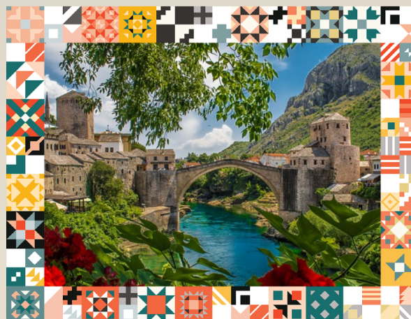
VIAGGIO: BANJA LUKA, SARAJEVO E MOSTAR 19 - 26 LUGLIO