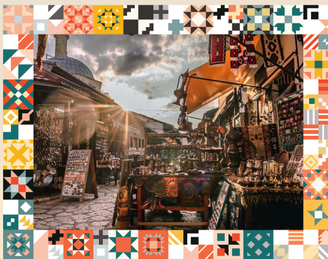
VIAGGIO: SARAJEVO, SREBRENICA E MOSTAR 30 AGOSTO - 6 SETTEMBRE

INFO E LOGISTICA (dotarsi di carta verde)