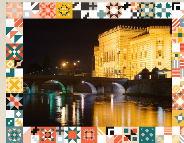
VIAGGIO: SARAJEVO, SREBRENICA E MOSTAR 26 LUGLIO - 2 AGOSTO